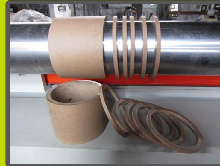
Detalle de la sección de corte